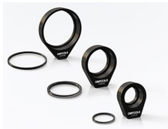
F2H - Фиксированный держатель линз