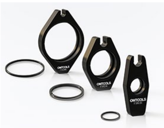
F1H - Фиксированный держатель линз с U - слотом